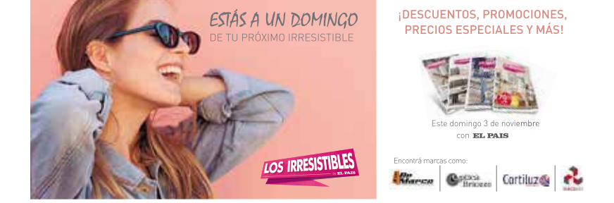
Avisos con presencia de logo de las marcas