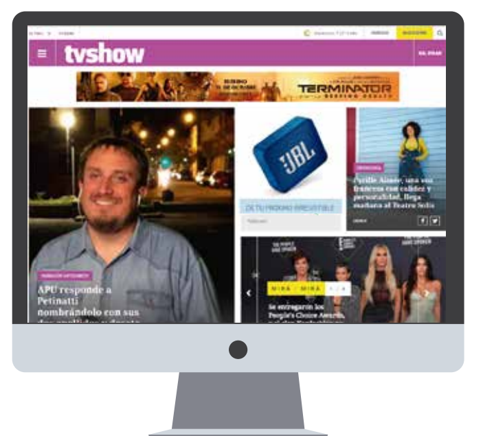
Banner con producto del cliente